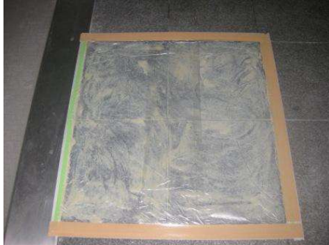
洗浄剤+トルネード湿布中