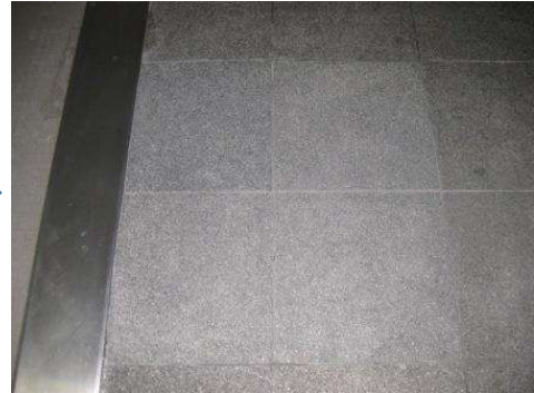
洗浄剤+トルネード回収・洗浄後