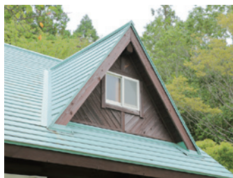
■ 屋根外装部（カラー鋼板、折板屋根等）