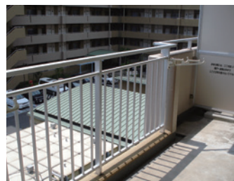
■ エアコンの室外機