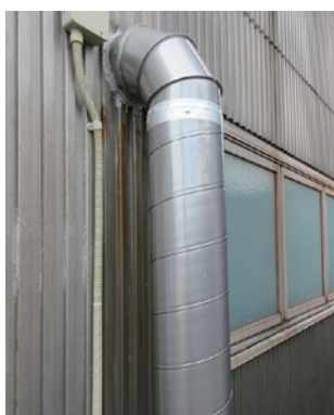
■ 工場外部の配管・ダクトの錆止め・保護