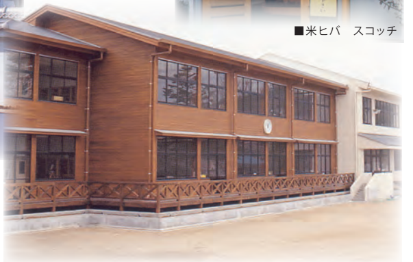
■紫尾(しび)小学校(鹿児島) チーク