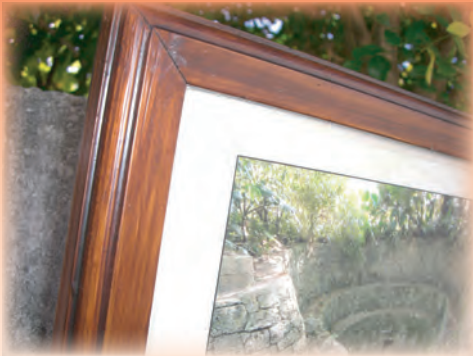
■首里城まちづくり説明板(沖縄) チーク