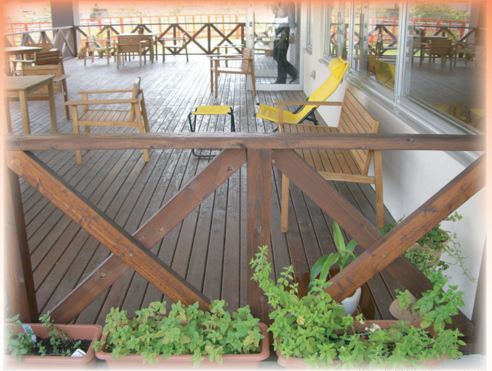
■美里の杜(沖縄) ウォールナット