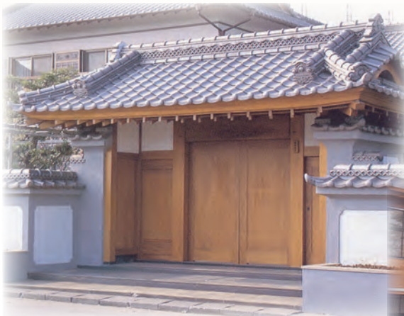
■古川銘木店(宮崎) スコッチ