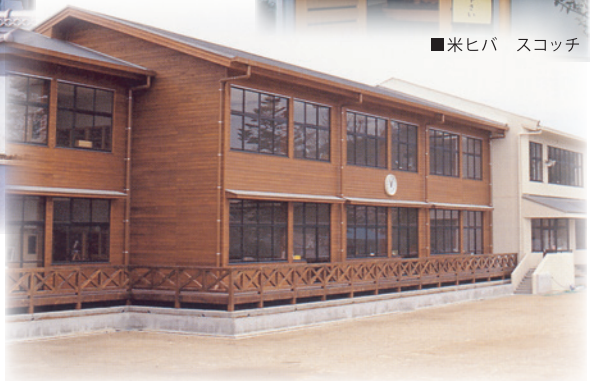
■紫尾(しび)小学校(鹿児島) チーク