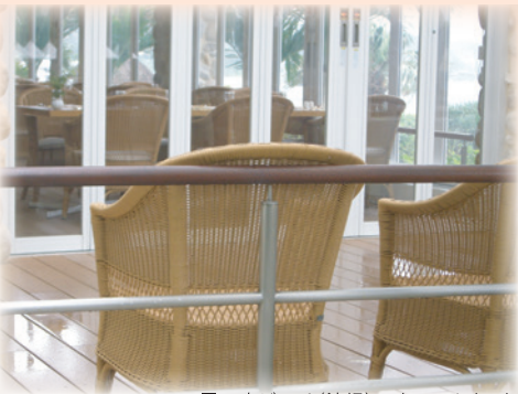
■万座ビーチ(沖縄) ウォールナット