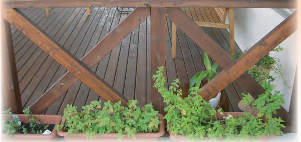
■美里の杜(沖縄) ウォールナット