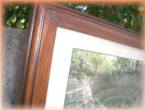
■首里城まちづくり説明板(沖縄) チーク