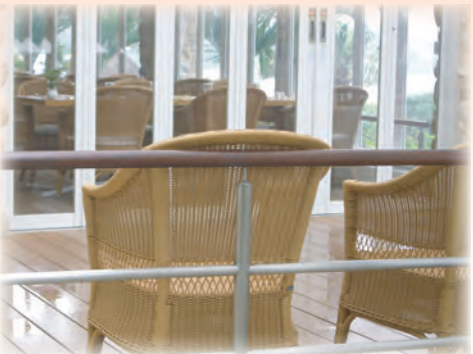
■万座ビーチ(沖縄) ウォールナット