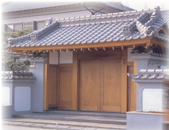
■古川銘木店(宮崎) スコッチ